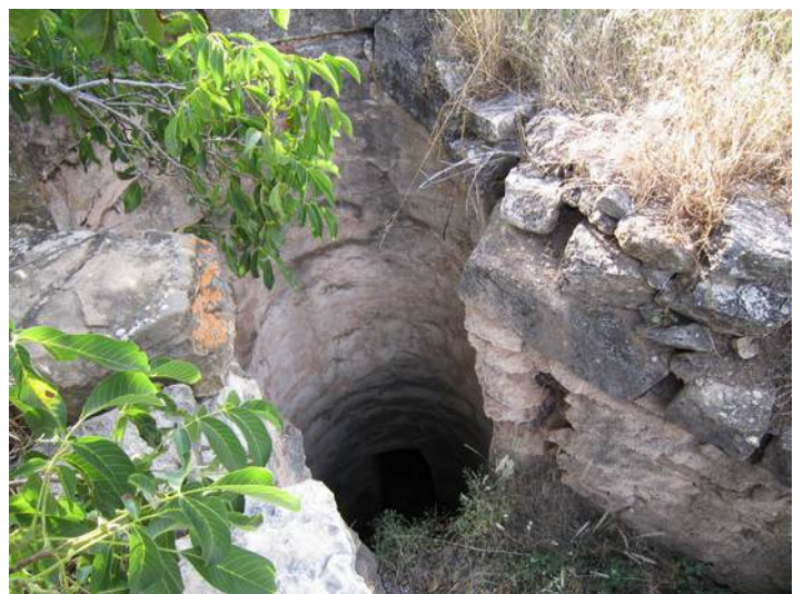
Ilustración 5: Parte de arriba del molino de Plou, también conocido como de la Carrera, y su cubo.