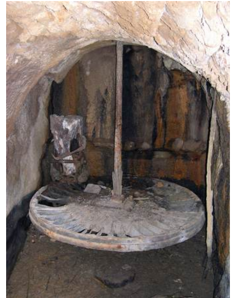
Ilustración 3: Poderosa fachada del molino de la Canal, en Huesa del Común, y su cárcavo y rodete.

- Ángel, tu que has sido cliente de los molinos, ¿Supongo que si había agua en los todos los molinos la gente preferiría ir al molino de la Canal, que estaba más cerca de Huesa?