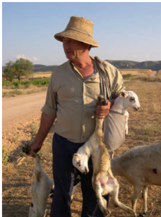
Una de las fotos ganadoras del concurso Albayar 2005:

¡Selecciona tus mejores fotografías y participa!