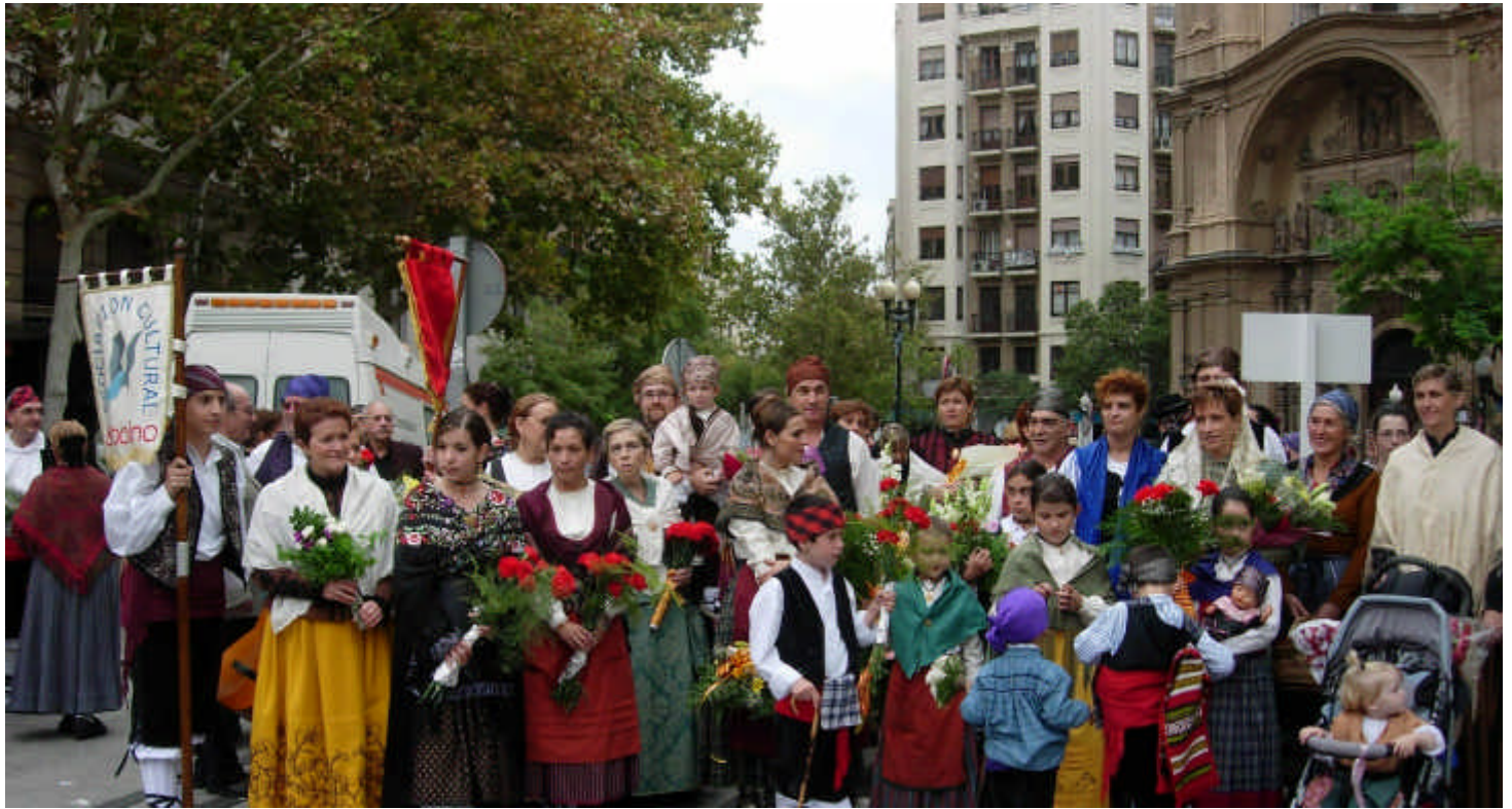
Arriba. Parte del grupo blesino en la ofrenda de flores del Pilar.