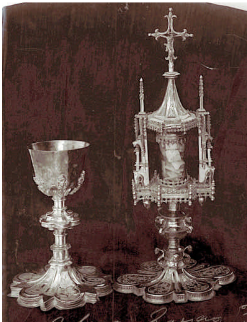
"Cáliz de plata sobredorada de la Iglesia Parroquial (Blesa, Teruel) 1908-1910"