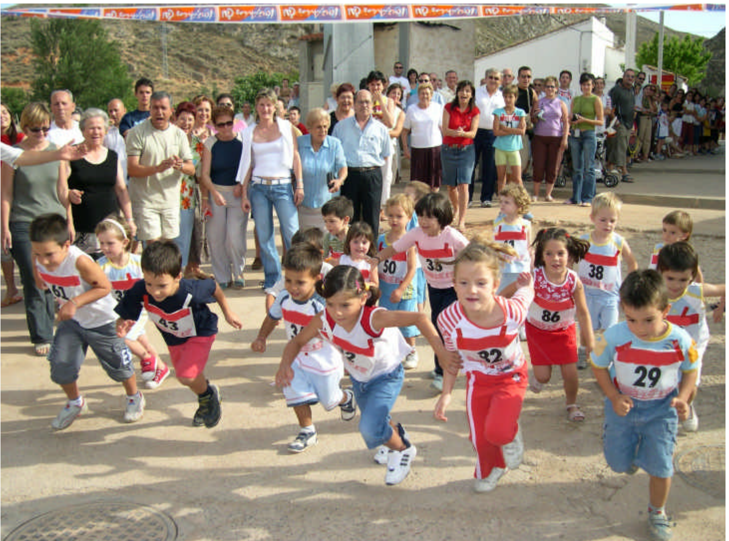
Debajo. El futuro de Blesa a por todas, en la Milla de los Molinos de Blesa.